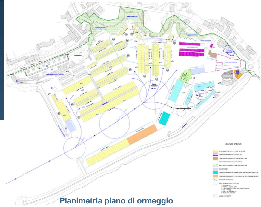
Planimetria piano di ormeggio